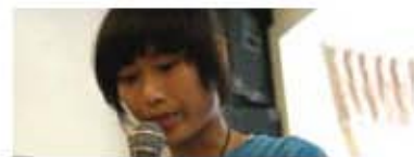
베트남 청소년대표 폐회식 인사말